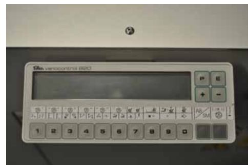
Common control box and panel for all units