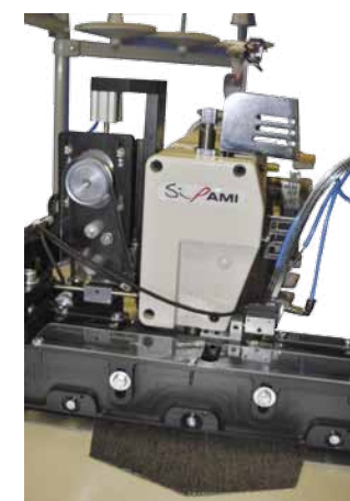
Patented pressure feeding control