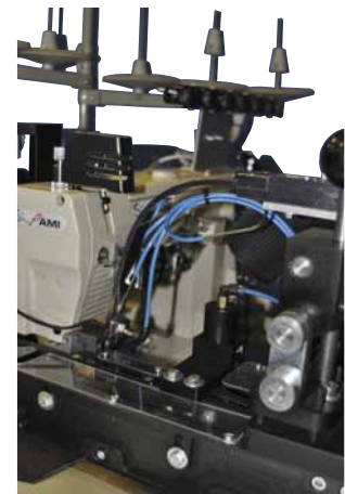
Option label insertion device